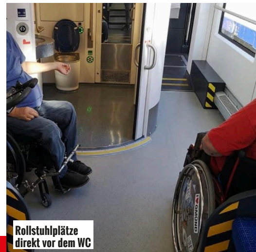
Rollstuhlplätze direkt vor dem WC