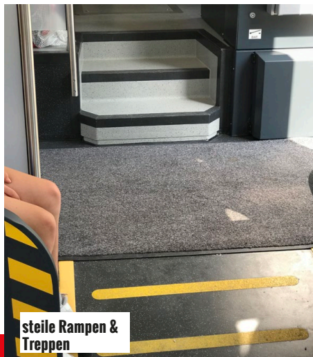
steile Rampen & Treppen