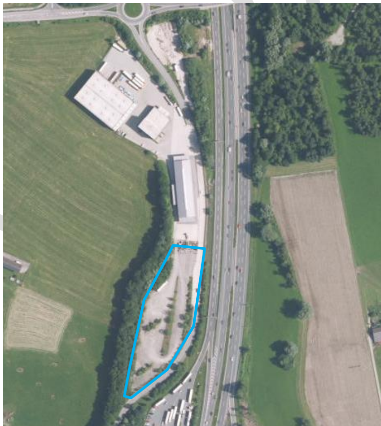
Abb. 1 Plangebiet mit Umgriff der 1. Änderung des rechtsverbindlichen Bebauungsplans „GE Autobahn West“ (blau, ohne Maßstab, Stand 12.01.2024)

Der Bebauungsplan „GE Autobahn West“ vom 11.01.2006 soll in diesem Teilbereich aufgehoben werden. Der Bebauungsplan sieht für den Bereich ein eingeschränktes Gewerbegebiet mit einem Baufenster vor. Nach der Aufhebung wird der Bereich planungsrechtlich zum Außenbereich gezählt. Eine bauliche Entwicklung ist nicht vorgesehen.